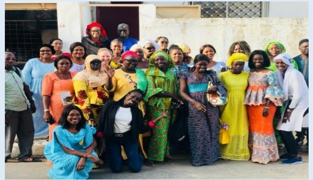
Photos prises lors des ateliers sur la planification stratégique