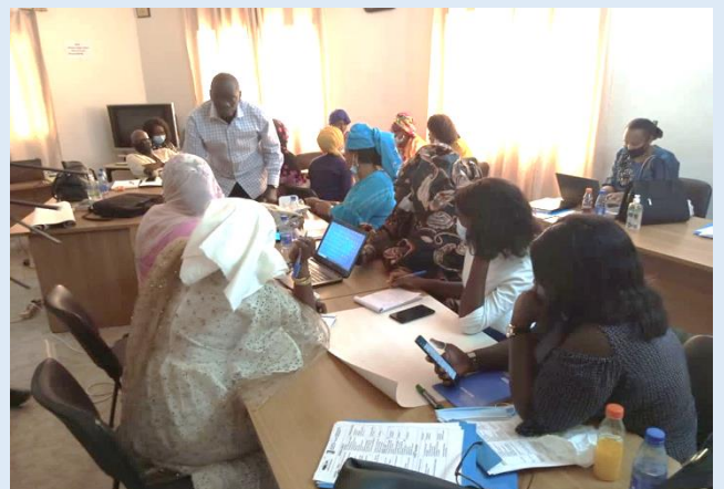
Photos prises lors de l'atelier sur la gestion de projet