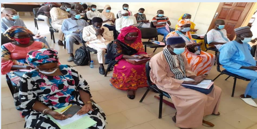
Photo prise lors de la rencontre de plaidoyer avec le maire de Rufisque- Est